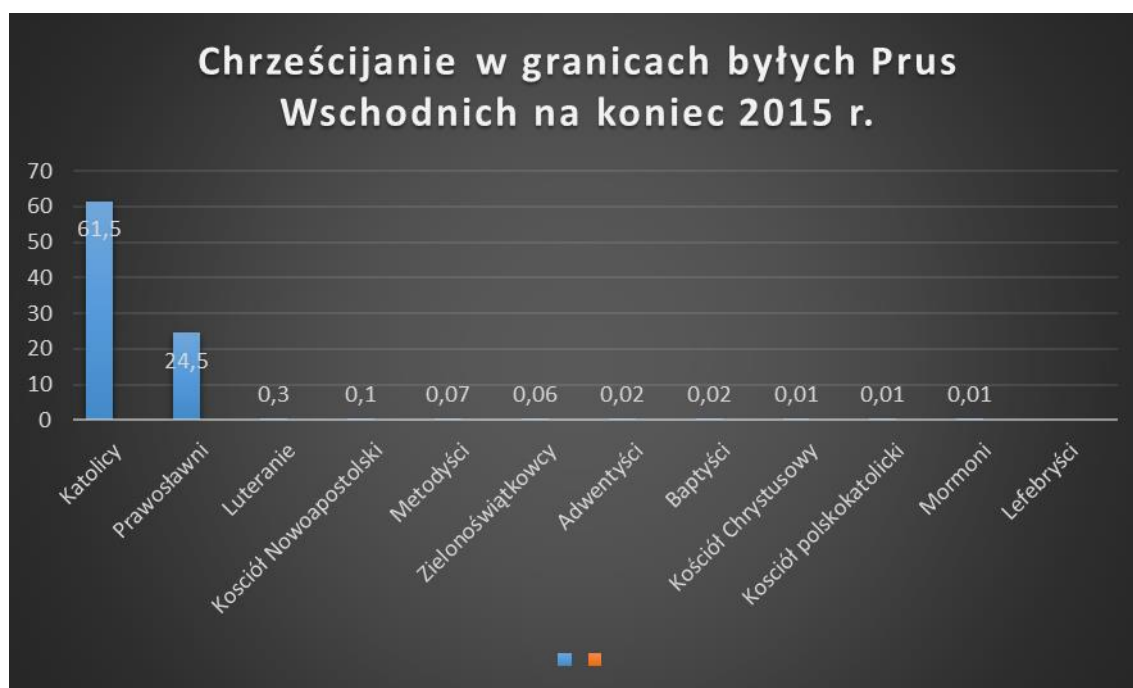
dane w procentach